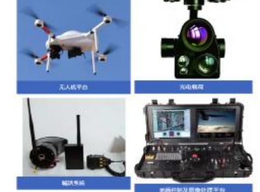
基于神经网络的智能无人机疫情预警监控系统组成

数据分析等关键技术，与同为江苏雷科防务下属的奥瑞思智能科技（天津）有限公司的多旋翼长航时无人机平台技术相结合，及时开发出基于神经网络的智能无人机疫情预警监控系统。