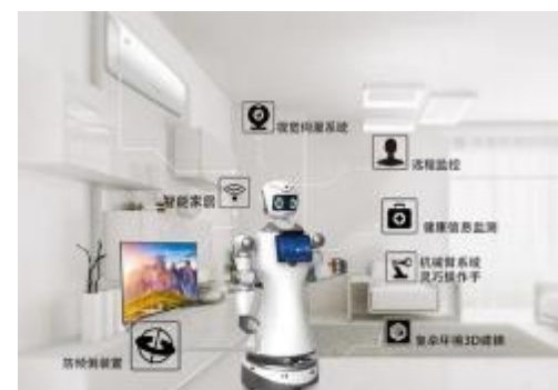
医院隔离病房自主护理机器人示意图

同时，根据当前复工、复课时的防控需求，团队还紧急研发了具备自动测温、自动消毒、自动问询和智能报表功能的“企业复工防疫机器人”和“学校复课防疫机器人”，得到了政府部门、一线工作人员和市民群众的一致肯定，并将陆续在长沙、杭州、合肥等地区投入使用。