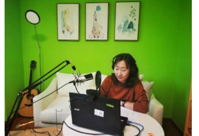
“职·心工作坊”教师与同学们连线开展团体辅导

截至 2020 年 4 月 8 日，在全校共同努力下，2020 届毕业生全员就业率相比于春节假期前增长 19.17%，其中本科生增长 17.58%，硕士生增长 19.43%，博士生增长 22.92%。