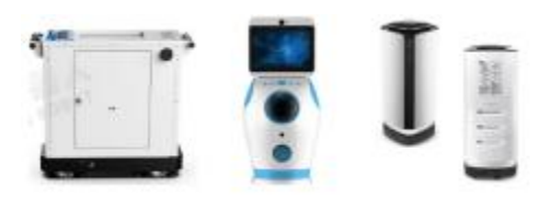
物资递送、远程诊疗、消毒杀菌机器人

随着复工返城高潮来临，各公共场所疫情防控任务愈加繁重。使用机器人代替人工防控，可极大降低防疫工作中的交叉感染风险，缓解防控一线人员的工作压力，降低防疫物资消耗。