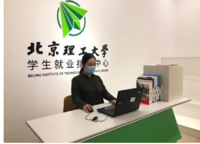
学生就业指导中心教师在为学生做远程就业指导

作坊”七大专栏，专家在线为毕业生提供指导，迅速实现疫情防控期间就业指导线上“全覆盖”。